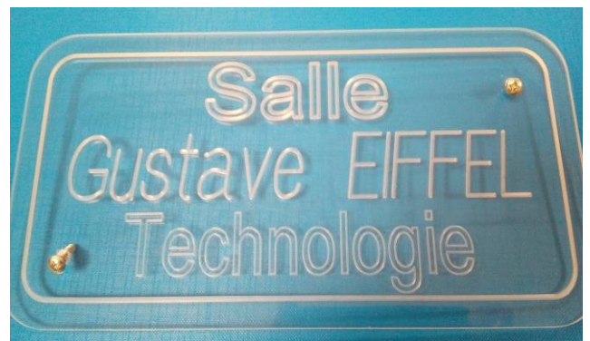
Plaque d'une salle de sciences