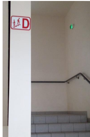
Plaque escalier fixée