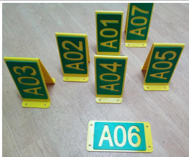
Drapeaux des bureaux

Descriptif rapide : Cette activité se place dans le cadre de la réalisation d'un objet technique, dans la suite du travail réalisé l'année précédente (Réalisation d'objets utiles et durables, responsabilisation des élèves sur le respect des locaux : Amélioration de la signalétique du collège). Cette troisième phase a permis de réaliser la signalétique du bâtiment administratif, sur le modèle des réalisations précédentes, avec quelques ajouts (Plaquettes avec noms des personnels, panneau récapitulatif, signalétique auto collante...).