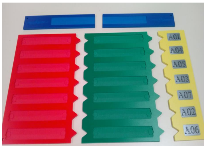
Préparation des pièces du panneau