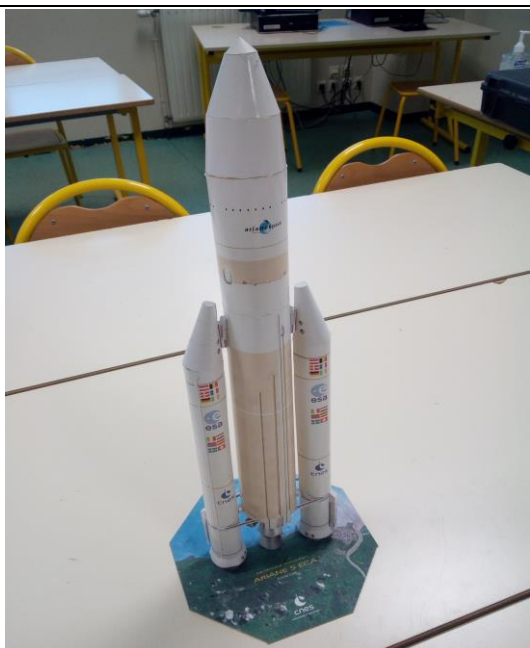
La maquette réalisée par les élèves

Descriptif rapide : Cette activité se place dans le cadre de la réalisation d'un objet technique. Suite à des recherches réalisées sur Internet par les élèves, ces derniers doivent réaliser une petite fusée. Cette activité est complémentaire d'une autre réalisation (voir Fusée objectif Lune). Les élèves doivent se partager les tâches pour assembler une maquette dont les pièces sont découpées sur des planches imprimées sur papier photo à partir d'un fichier fourni par le CNES (d'autres maquettes sont disponibles). Un dossier technique est également fourni sur ce même site.