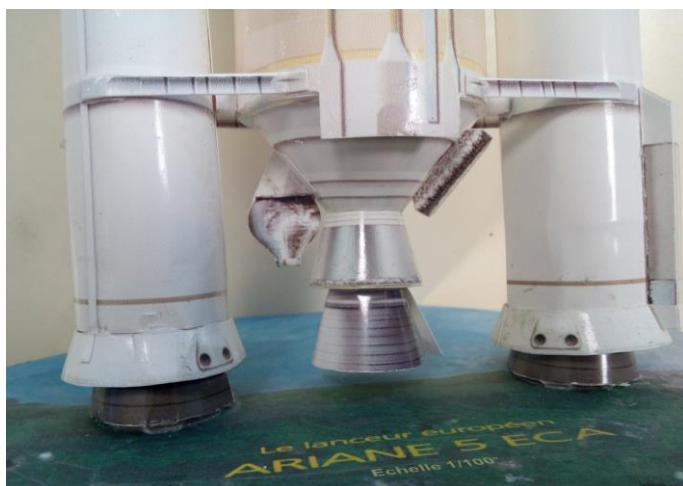
Détail d'une partie de la maquette