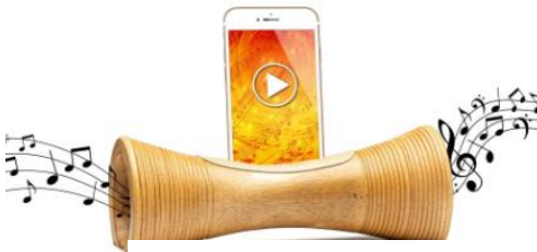
Enceinte pour téléphone portable