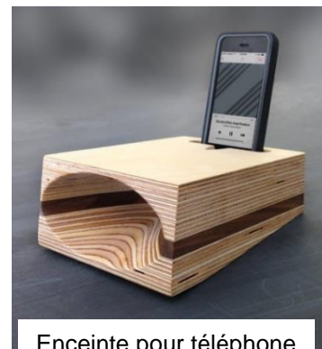
Enceinte pour téléphone portable

Quelle forme est utilisée pour diffuser le son sur ces quatre objets ?