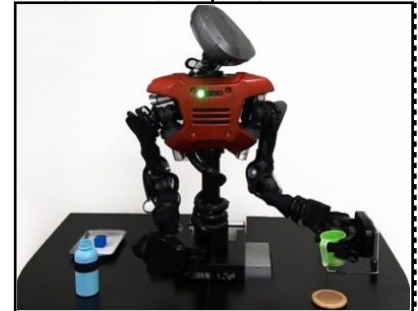
Hiro, 1er robot intelligent 2011