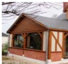
Type de façade