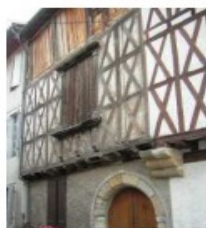
Site classé, site historique, ...