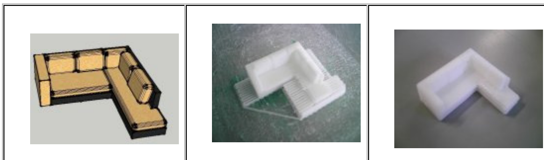
Modèle sketchup 3D